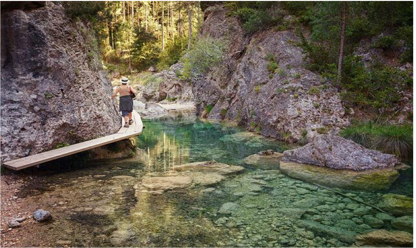
Pueblo: San Martín del Castañar-Río